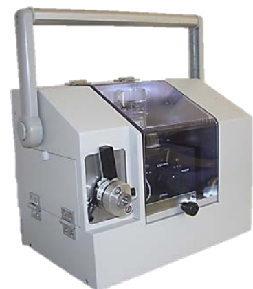
本体 (幅27cm×奥行19cm×高さ22cm) 特許 第5935696号

液体クロマトグラフは、混合試料を成分ごとに分けたのち各濃度を測定する装置です。現在、化学工業、医薬品、食品、臨床検査、環境の分野で広く利用されています。しかし、サイズおよび重量ともに大きいため、実験室での使用に限定され、試料の採取場所での分析や小規模な実験室での分析は困難でした。そこで、わたしたちは構成要素を根本から小型化することに取り組み、超小型・超軽量装置の開発に成功しました。