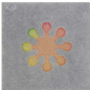
図 紙チップによる化学分析の例