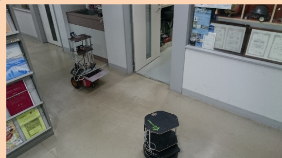
複数ロボットの協調による作業効率化