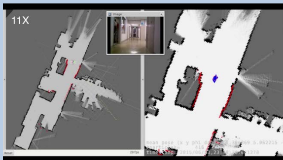
レーザ測距計による2次元マップの獲得